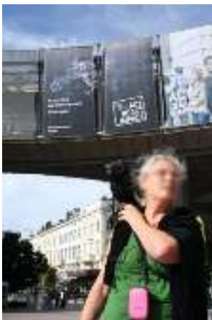
Foto: 'So you think you have no power? Think again!' - actie Freedom Not Fear bij EU Parlement te Brussel september 2013.

Een voorname rol bleef weggelegd voor het ondersteunen van particulieren die door aantasting van de privacy in de problemen kwamen of dreigde te komen en zich daartegen te weer wilden stellen. Een advies- en hulpverleningsfunctie die eveneens aan vele verwante mensenrechtenorganisaties ten goede kwam en ingezet werd om binnen de politiek en het bedrijfsleven een beter beleid te bewerkstelligen.