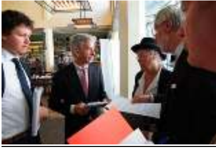
demonstratie 'hoge hoed'

Het hele jaar door heeft Vrijbit zich nog tot het uiterste moeten inspannen om de aangekondigde wijziging van de Paspoortwet, aangaande de uitgifte van 'vingerafdrukloze' ID-kaarten, door het parlement te laten aannemen.